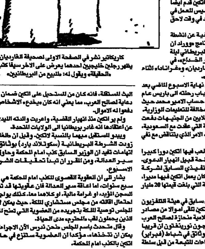
كاركاتير نشر في الصفحة الأولى لصحيفة الغرديان أسس يظهر رجلاً خبيثاً يبيع عرض الأخرى سلفاً على طبقه، معلقاً في البيوتانية.

الحديث أبرز في هذه الحملات والانتهاكات المتبادلة، ضبط وزير الثقافة في الله الأمازيغي وهو رئيس المجلس المستوري (بين) بمارس الضغط والرشوة لزوجته أحد أعضاء المجلس البلدي في اغاير لإقناع زوجها بالتصويت لصالح الوزير، وتم ضبط الوزير بكن نصيبه مئولو المعارضة في المدينة الذين جعلوا مواطنين أحمالوا، وانتزحوا الضيق، وتم احتجاز رجال السلطة بالاحكام الانتخابية، والاستراتيجية في حالة شخص بكل هذا التسلل من الشؤون السياسية، فحلت مقلقة بالأموال ويوجه إلى منزل الاستخبارات بهدف الضغط على زوجته قصد شراء صوت زوجها، غاية ثقافة يشيخها في الانتخابات بضغط حقيقي وزواة الثقافة أنه يخلعه ذاته ويكاف من حقيقة مشروع الثقافي والذي لا يمكن الاكتفاء بكلمة واحدة ثقافية للاسناد، ولكن تحرك وهو في الحقيقة، مبدع في فهمه وأمواله بمرور فخصائصه غير ابيين بدقة للرحلة السياسية للبلاد، ولا يمتدحها، ولا حتى بالأساليب العمومية لنقطة به.